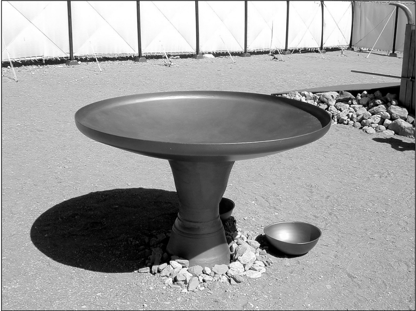
యిత్రడి గంగాళము యొక్క నకలు (తిమ్మా పార్కు, ఇశ్రాయేలు)

బహుకరణను ప్రత్యేకముగా ఇక్కడ ప్రస్తావించి ఉంటారు.