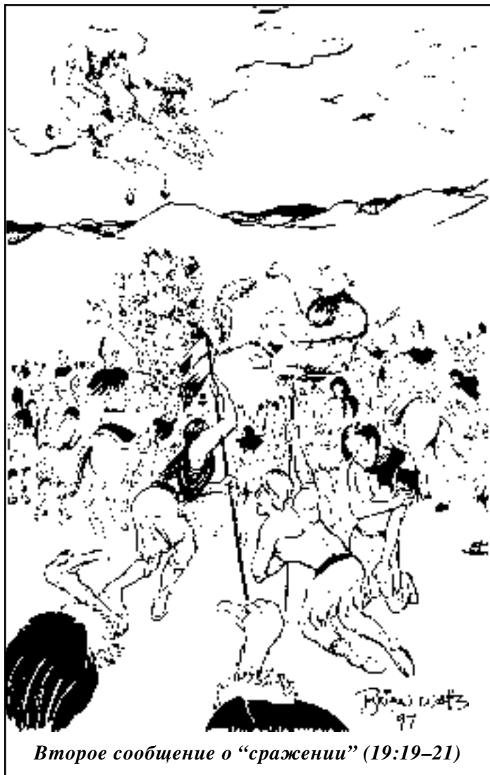
Второе сообщение о “сражении” (19:19–21)

Обратите особое внимание на тот факт, что исход предстоящей “битвы” не вызывает сомнения. Птицы позваны отобедать трупам врагов еще до того, как с противником завязался бой.