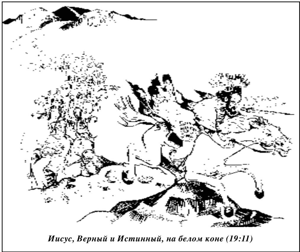
Иисус, Верный и Истинный, на белом коне (19:11)

Стих 16 – кульминационный: “На одежде и на бедре Его написано имя: Царь царей и Господь господствующих”. Моисей говорил израильтянам: “Ибо Господь, Бог ваш, есть Бог богов и Владыка владык” (Втор. 10:17). Навухо-