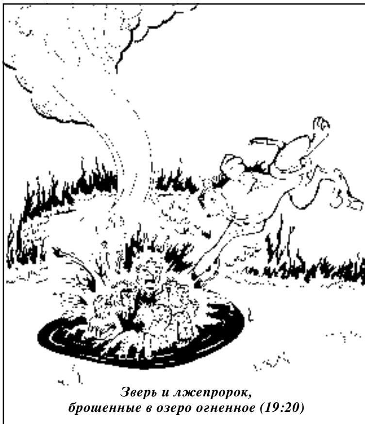
Зверь и лжепророк, брошенные в озеро огненное (19:20)

Последний стих нашего текста осуществляет две цели: говорит о судьбе тех, кто был обманут зверем и лжепророком, а также исполняет обещание, которое ангел дал птицам: “А прочие убиты мечом Сидящего на коне, исходящим из уст Его; и все птицы напитались их