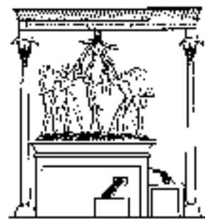
Египетский виноградный пресс

Такое раздавливание винограда в точиле было использовано в Ветхом Завете в качестве символа Божьего правосудия (Ис. 63:3; Плач. 1:15; Иоил. 3:13). Этот символ, во всей видимости, имел особый смысл для гонимых христиан: как подавляли их, так будут раздавлены и их притеснители. Джулия Уорд Хоуи уловила тонкость языка ветхозаветных писаний и Откровения в своем волнующем “Боевом гимне республики”: