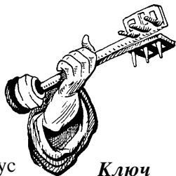
Ключ Давидов (3:7)

Один только Иисус владеет этим ключом. Поэтому никто не может закрыть то, что Он открывает, и никто не может открыть то, что Он закрывает. Он говорит христианам в Филадельфии, что отворил перед ними “дверь, [которую] никто не может затворить” (3:8б). Силы сатаны могут временно расстроить Господ-