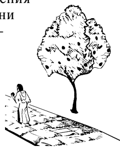
Вкушение от дерева жизни (2:7)

Чтобы когда-то вкушать от дерева жизни, эфесяне должны были вновь разжечь пламя любви. Слово “побеждающий” 35 здесь – это тот, кто одерживает верх над обстоятельствами, в которых оказывается. В этом письме “побеждающими” названы эфесяне, вновь обретшие энергию и жизненную силу своей первой любви.