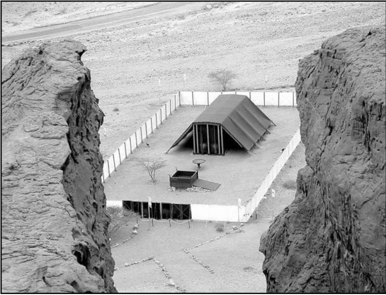
ਡੇਹਰੇ ਅਤੇ ਹਾਤੇ ਦਾ ਪ੍ਰਤਿਰੂਪ (ਤਿਮਨਾ ਪਾਰਕ, ਇਸਰਾਏਲ)