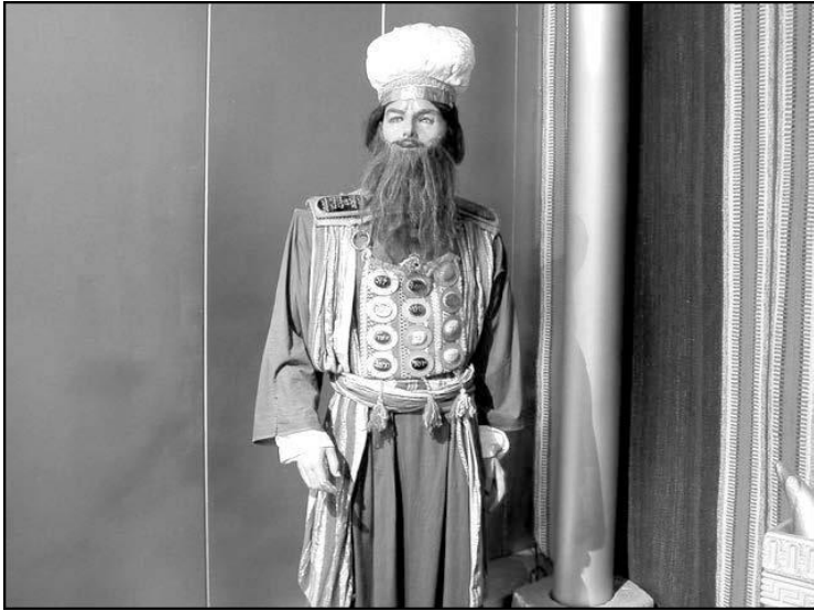
ਮਹਾਂ ਜਾਜਕ ਦੇ ਬਸਤ੍ਰਾਂ ਦਾ ਪ੍ਰਤਿਰੂਪ (ਤਿਮਨਾ ਪਾਰਕ, ਇਸਰਾਏਲ)