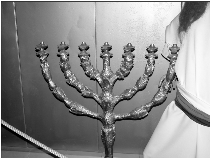
ਸ਼ਮਾਦਾਨ ਦਾ ਪ੍ਰਤੀਰੂਪ (ਟਿਮਨਾ ਪਾਰਕ, ਇਸਰਾਏਲ)

ਇਸਰਾਏਲੀਆਂ ਨੇ ਸੱਤ ਦੀਵਿਆਂ , ਗੁਲਦਾਨਾਂ ਅਤੇ ਸ਼ਮਾਦਾਨ ਦੇ ਸੰਬੰਧ ਵਿਚ ਲੋੜੀਂਦੇ ਹੋਰ ਭਾਂਡੇ ਬਣਾਉਣ ਦੇ ਲਈ ਕੁੰਦਨ ਸੋਨੇ ਦੀ ਵੀ ਵਰਤੋਂ ਕੀਤੀ ਸੀ (37:23, 24)। ਸ਼ਮਾਦਾਨ ਦਾ ਉਦੇਸ਼ - “ਆਹਮੇ ਸਾਹਮਣੇ ਚਾਨਣ ਦੇਣਾ ਸੀ” (25:37) - ਇਸ ਦੇ ਬਣਾਉਣ ਦੇ ਵਿਚਤਾਂਤ ਵਿਚ ਨਹੀਂ ਪਰ ਇਸ ਨੂੰ ਬਣਾਉਣ ਦੇ ਹੁਕਮ ਵਿਚ ਸਮਝਾਇਆ ਗਿਆ ਹੈ। (25:31-40 ਤੇ ਟਿੱਪਣੀਆਂ ਵੇਖੋ।)