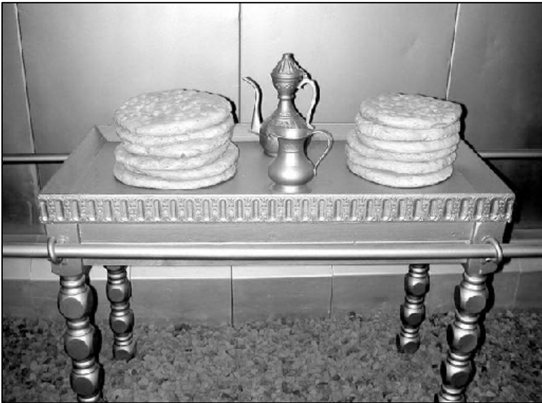
ਹਜ਼ੂਰੀ ਦੀ ਰੋਟੀ ਰੱਖਣ ਵਾਲੀ ਮੇਜ਼ (ਟਿਮਨਾ ਪਾਰਕ, ਇਸਰਾਏਲ)

ਮੇਜ਼ ਨੂੰ ਬਣਾਉਣ ਦੀ ਵਿਆਖਿਆ ਇਸ ਦੀ ਬਣਤਰ ਲਈ ਦਿੱਤੀਆਂ ਗਈਆਂ ਹਦਾਇਤਾਂ ਤੋਂ ਕੋਈ ਜ਼ਿਆਦਾ ਵੱਖਰੀ ਨਹੀਂ ਸੀ। ਪਰ, ਜਿਵੇਂ ਦੂਜੇ ਮਾਮਲਿਆਂ ਵਿਚ ਹੈ, ਸੁਰੂਆਤੀ ਯੋਜਨਾ ਵਿਚ 25:30 ਵਿਚ ਉਹ ਕਥਨ ਸ਼ਾਮਲ ਹੈ ਕਿ ਇਹ ਮੇਜ਼ ਕਿਵੇਂ ਵਰਤਿਆ ਜਾਣਾ ਸੀ, ਜਿਸ ਨੂੰ ਅੱਗੇ ਜਾ ਕਿ ਵਿਰਤਾਂਤ ਵਿਚ ਭੁਲਾ ਦਿੱਤਾ ਗਿਆ। (25:23-30 ਤੇ ਟਿੱਪਣੀਆਂ ਵੇਖੋ।)