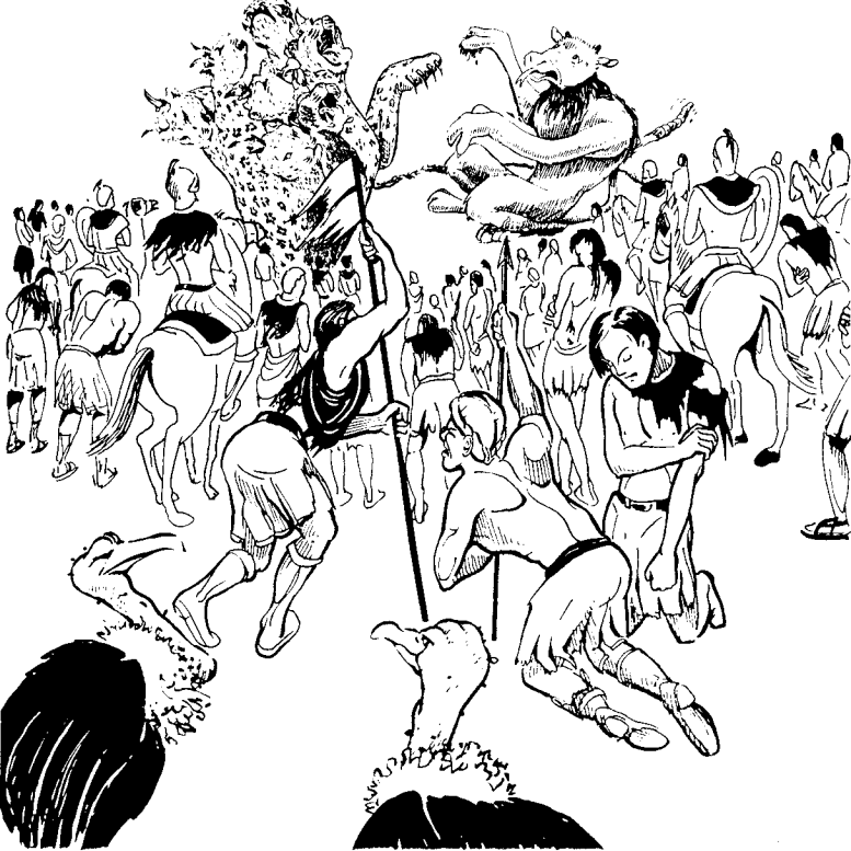
യുദ്ധത്തിനായി ഒന്നിച്ചു കൂടുന്നു (19:17-21)