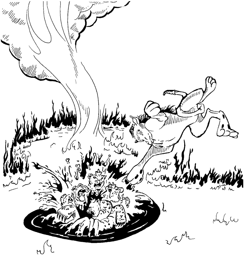
തീപ്പൊയ്കയിൽ തളിക്കളയുന്നു (19:20)