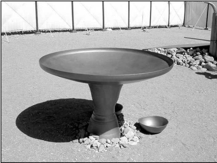
तल की हौदी का प्रतिरूप (तिम्ना पार्क, इस्त्राएल)

ये स्त्रियाँ कौन थी और वे किस प्रकार “सेवा” करती थी यह अस्पष्ट है। इब्रानी शब्द (מַצֵּבָה, टस्वा) ऐसा सुझाता है कि जो सेवा वे करती थी उसी के लिए उनका गठन किया गया; इस शब्द का प्रयोग लेवीय याजकों की “सेवा” के लिए भी किया गया है (गिनती 4:23; 8:24)। 2 टीकाकारों ने यह सुझाव दिया है कि वे सम्भावित रूप से निवास-स्थान के आँगन की देखभाल करने के लिए सफ़ाई करने वाली, धार्मिक उत्सवों पर गायिकाओं और नृत्य के द्वारा प्रस्तुति देने वाली (देखें 15:20, 21), अथवा चौकीदार के रूप में महिलाओं का एक समूह रही होंगी। 3 1 शमूएल 2:22 के कारण हो सकता है कि कुछ लोगों उनका सम्बन्ध बाल की आराधना के लिए मन्दिरों की एक पंथ विशेष की देवदासियों के साथ बताते हों। फिर भी इस सुझाव को अस्वीकार कर देना चाहिए क्योंकि निवास-स्थान और इसकी सेवा के लिए परमेश्वर की योजना में इस प्रकार के अभ्यास के बारे में विचार भी नहीं किया जा सकता। 4