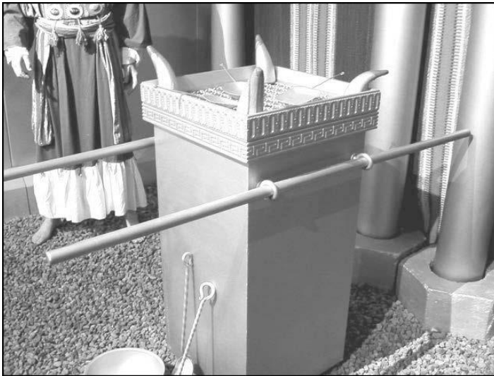
धूप वेदी का प्रतिरूप (तिम्ना पार्क, इस्त्राएल)

आयतें 25-28. भेंट की रोटियों के लिए मेज़ के समान धूप वेदी का निर्माण बबूल की लकड़ी से किया गया और उसे सोने से मढ़ा गया। इसके ऊपर सींग थे - ये चारों कोनों में से निकले थे - और इसका ऊपर का हिस्सा चारों ओर से सोने से मढ़ा हुआ था। निवास-स्थान की अन्य लकड़ी के समान इस वेदी में भी कड़े लगे हुए थे जिससे इसे डण्डों से उठाया जा सके। इसे बनाने के लिए दिए गए निर्देशों में यह भी शामिल था कि इसे कहाँ रखा जाना है और इसका प्रयोग किस प्रकार किया जाएगा (30:6-10) परन्तु इसके निर्माण का विवरण मात्र यह बताता है कि इसे तैयार किया गया। (30:1-10 पर टिप्पणियाँ देखें।)