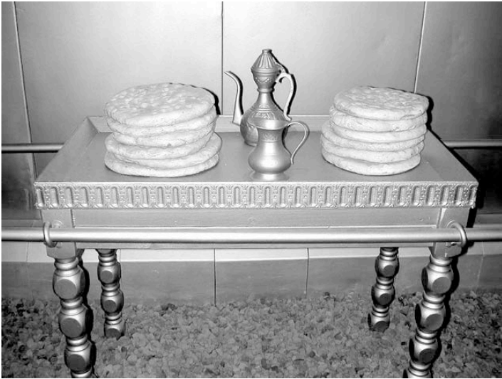
भेंट की रोटियों के लिए मेज़ का प्रतिरूप (तिम्ना पार्क, इन्चाएल)

मेज़ के निर्माण का विवरण, इसके निर्माण के लिए दिए गए निर्देशों से किसी विशेष रूप में अन्तर नहीं रखता। फिर भी जैसा अन्य विषयों में देखने को मिलता है, आरम्भिक योजना एक कथन शामिल करती है कि 25:30 में मेज़ का प्रयोग किस प्रकार किया जाना चाहिए था, जिसे बाद का विवरण छोड़ देता है (25:23-30 पर टिप्पणियाँ देखें)।