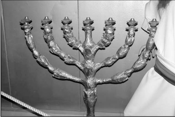
सोने की एक दीवट का प्रतिरूप (तिम्ना पार्क, इस्त्राएल)

आयतें 17-24. सजावट की अगली वस्तु जिसे बसलेल ने पवित्रस्थान के लिए बनाया वह सोने का दीवट था। इस वस्तु के लिए प्रायः इब्रानी शब्द מִינְוֹרָה ( मिर्नोराह ) के द्वारा संकेत दिया जाता है। पवित्रस्थान की अन्य सब वस्तुओं की तुलना में यह चोखे सोने से बना हुआ था (37:17)। दीवट में केन्द्र भाग के रूप में एक डण्डी थी जिसमें से छः डालियाँ निकली हुई थी, तीन डालियाँ उसके एक ओर से और तीन डालियाँ उसके दूसरी ओर से निकली हुई थी (37:17, 18)। प्रत्येक भाग को सोने की गाँठों और फूलों से सुन्दर तरीके से सजाया गया (37:19-22)। केन्द्र की डण्डी और छः डालियाँ सात दीपक धारकों में से होते हुए ऊपर पहुँचा दी गई।