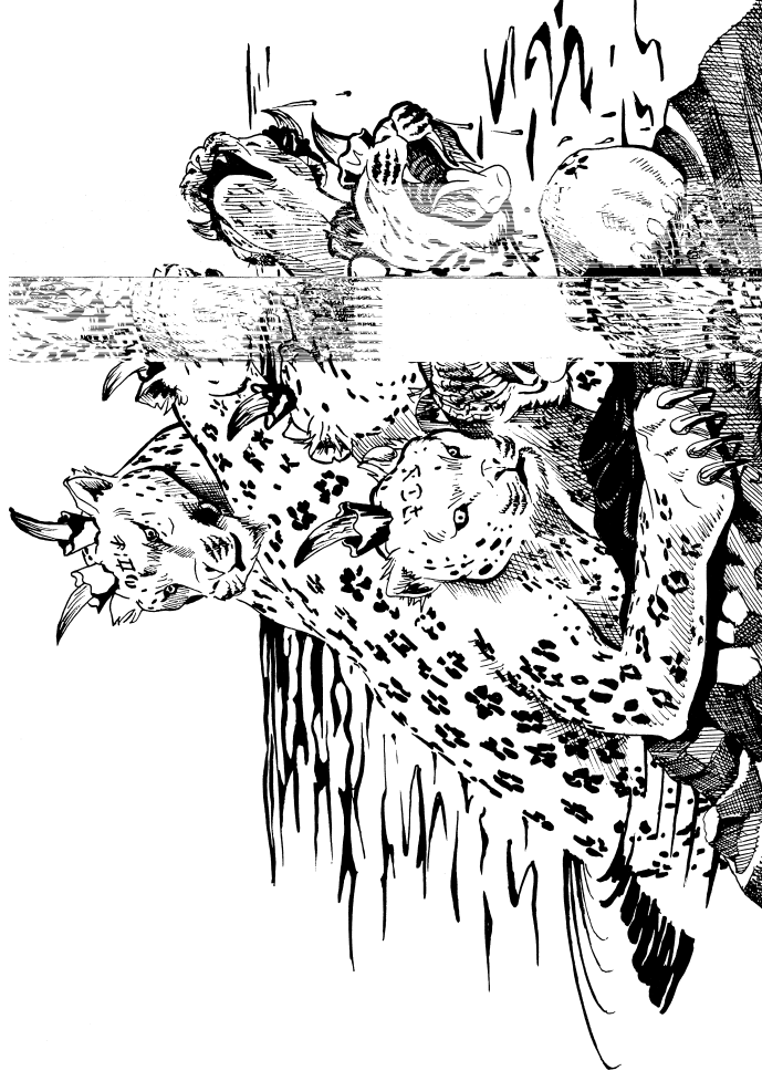
கடல் மிருகம் (13:1, 2)