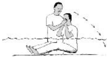
ਬਪਤਿਸਮਾ ਲੈਣ ਵਾਲਾ/ਵਾਲੀ ਡੁੱਬੇ ਪਾਣੀ ਵਿਚ ਬੈਠ ਜਾਵੇ ਅਤੇ ਪਿੱਛੇ ਨੂੰ ਇਸ ਤਰ੍ਹਾਂ ਝੁਕੇ ਕਿ ਉਹ ਪਾਣੀ ਵਿਚ ਪੂਰੀ ਤਰ੍ਹਾਂ ਡੁੱਬ ਜਾਵੇ।

ਤੀਸਰੀ, ਉਹਨੂੰ ਬਪਤਿਸਮਾ ਦਿੰਦਿਆਂ, ਇਹ ਧਿਆਨ ਰੱਖੋ ਕਿ ਪਾਣੀ ਵਿਚ ਪੂਰਾ ਡੁੱਬ ਜਾਵੇ। ਯਾਦ ਰੱਖੋ ਕਿ ਨਵੇਂ ਨੇਮ ਵਿਚ ਬਪਤਿਸਮੇ ਦਾ ਮਤਲਬ ਪਾਣੀ ਵਿਚ ਦਫ਼ਨ ਹੋਣਾ ਹੈ (ਰੋਮੀਆਂ 6:4)। ਹੇਠਾਂ ਕੁਝ ਤਸਵੀਰਾਂ ਵਿਖਾਈਆਂ ਗਈਆਂ ਹਨ ਜਿਨ੍ਹਾਂ ਤੋਂ ਪਤਾ ਲਗਦਾ ਹੈ ਕਿ ਬਪਤਿਸਮਾ ਕਿਵੇਂ ਹੋ ਸਕਦਾ ਹੈ: