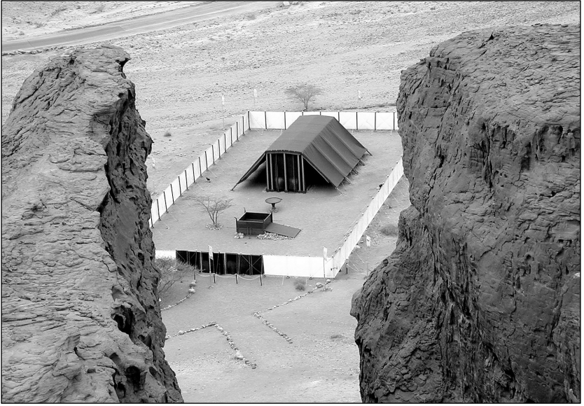
ప్రత్యక్షపు గుడారము మరియు ఆవరణము యొక్క నకలు (తిమ్నా పార్కు, ఇశ్రాయేలు)