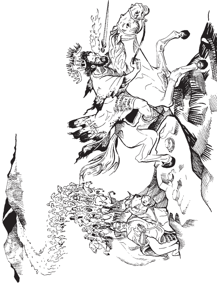
యేసు, తెల్ల గుఱ్ఱం మీద నమ్మకమైనవాడును సత్యవంతుడైనవాడును (19:11)