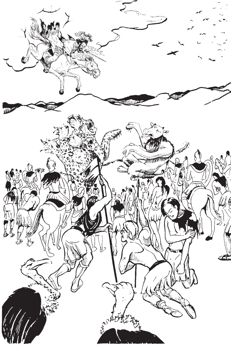
“యుద్ధం” యొక్క రెండవ వర్ణన (19:19-21)