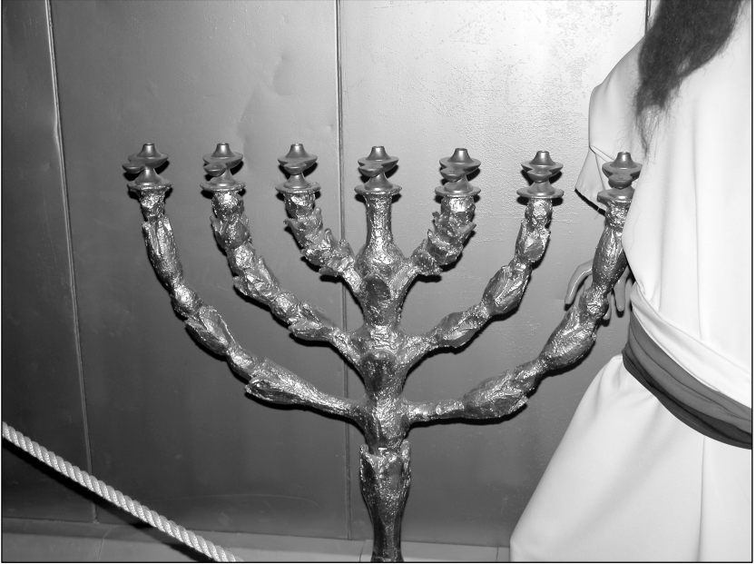
దీపవృక్షము యొక్క ప్రతిరూపము (తిమ్నా పార్కు, ఇశ్రాయేలు)

17 అతడు మేలిమి బంగారుతో దీపవృక్షమును చేసెను. ఆ దీపవృక్షమును దాని ప్రకాండమును దాని కొమ్మను నకిషి పనిగా చేసెను. దాని కలశములు మొగ్గలు పువ్వులు ఏకాండమైనవి. 18 దీపవృక్షముయొక్క ఇరుప్రక్కలనుండి మూడేసికొమ్మలు అట్లు ఆని ప్రక్కలనుండి ఆరు కొమ్మలు బయలుదేరినవి. 19 ఒక కొమ్మలో మొగ్గలు పువ్వులుగల బాదము రూపమైన మూడు కలశములు; అట్లుదీపవృక్షమునుండి బయలుదేరిన ఆరు కొమ్మలకు ఉండెను. 20 మరియు దీప వృక్ష మందు దాని మొగ్గలు దాని పువ్వులుగల బాదమురూపమైన నాలుగు కలశములుండెను. 21 దీపవృక్షమునుండి బయలుదేరు ఆరు కొమ్మలలో రెండేసి కొమ్మల క్రింద ఏకాండమైన మొగ్గయునుండెను. 22 వాటి మొగ్గలు వాటి కొమ్మలు ఏకాండమైనవి; అదంతయు ఏకాండమైనదై మేలిమి బంగారుతో నకిషి పనిగా చేయబడెను. 23 మరియు అతడు దాని యేడు ప్రదీపములను దాని కత్తెరను దాని పట్టుకారును దాని కత్తెరచిప్పను మేలిమి బంగారుతో చేసెను. 24 దానిని దాని ఉపకరణములన్నిటిని నలుబది వీసల మేలిమి బంగారుతో చేసెను.