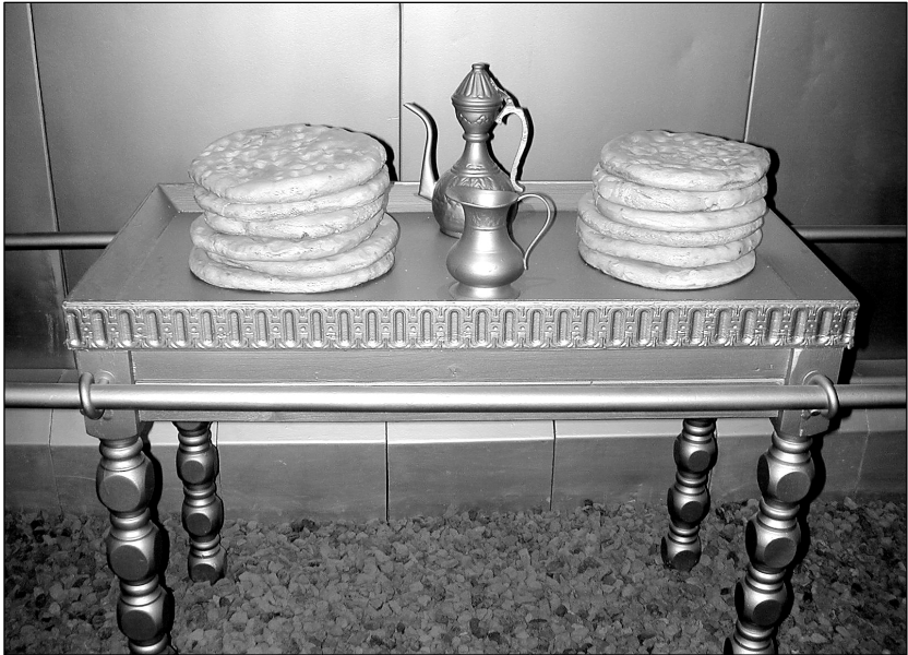
రొట్టె బల్ల యొక్క ప్రతిరూపము (తిమ్నా పార్కు, ఇశ్రాయేలు)

బల్ల యొక్క నిర్మాణము యొక్క వివరణ దాని నిర్మాణమునకు ఇవ్వబడిన సూచనలలో గుర్తించదగినంతగా భిన్నముగా ఉండదు. అయితే, కొన్ని ఇతర సందర్భములలో వలె, ప్రారంభ ప్రణాళిక బల్ల ఎలా వాడబడునో అని 25:30లో ఒక ప్రకటనను చేర్చును, అదే తర్వాత సందర్భములో వదిలివేయును. (25:23-30 పై వ్యాఖ్యలను చూడుము.)