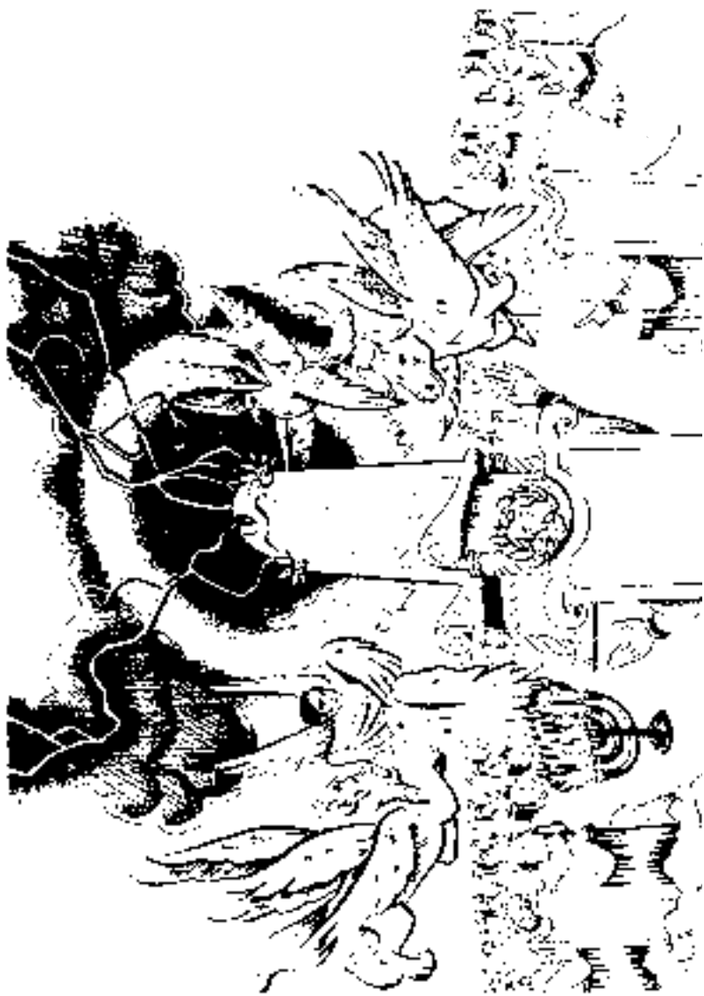
സിഹാസനത്തിനു ചിറ്റുമുള്ള കാഴ്ച (4:2-8)