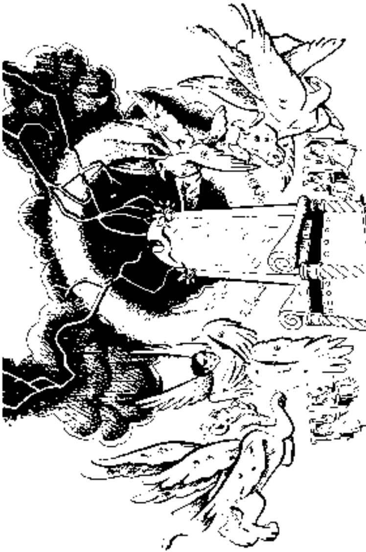
സിംഹാസനത്തിനു ചുറ്റും നാല് ജീവികൾ (4:5-8)