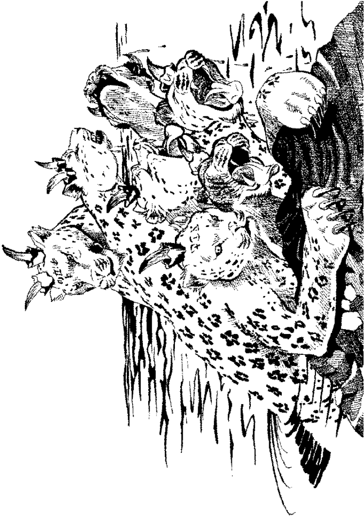
മൃഗം സമുദ്രത്തിൽനിന്നു കയറിവരുന്നു (13:1-3)