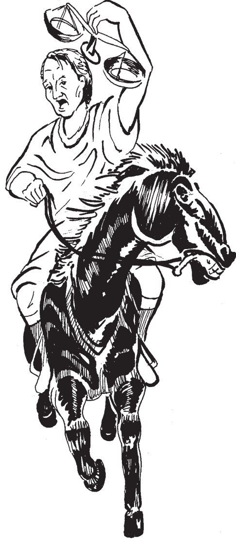
మాడవ రౌతు (6:5)